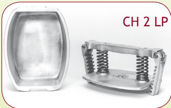
CH 2 LP